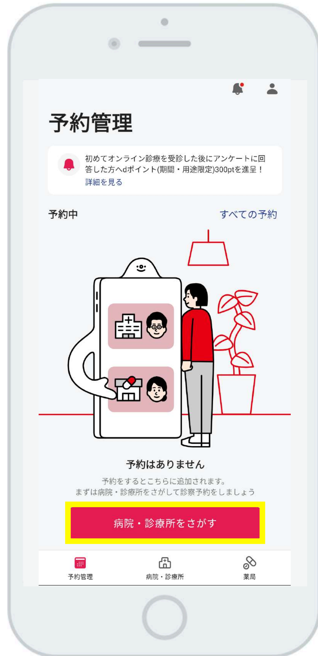
①病院・診療所をさがす