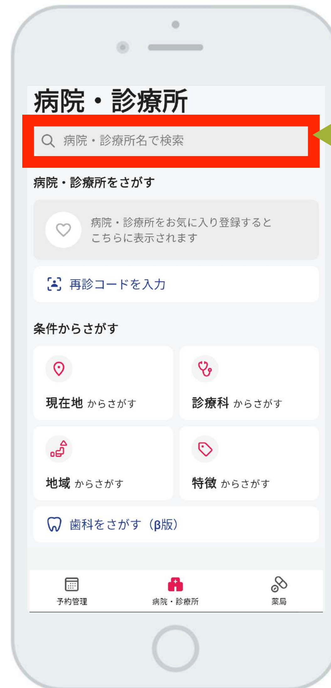
②「かがみハーモニークリニック」を検索